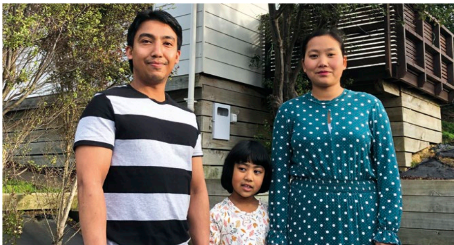
Ko Naing Naing mo hono fāmilī 'i tu'a 'i honau 'api nofo'anga fo'ou.

'Oku 'oatu 'a e talamonū ma'olunga ki he fāmilī nofo totongi-tutuku ko enī ne fakatau 'enau 'uluaki fuofua 'api nofo'anga, ko ha fale fakaonopooni loki-tolu, 'i Porirua ne ngāue'aki 'enau KiwiSaver mo e noo First Home Loan ke kumi 'aki.